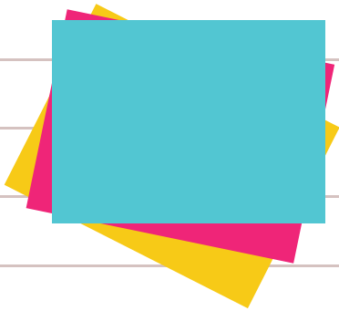
Kertas warna - warni