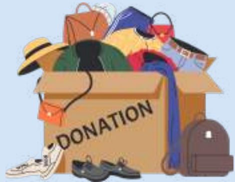
Pakaian atau aksesoris