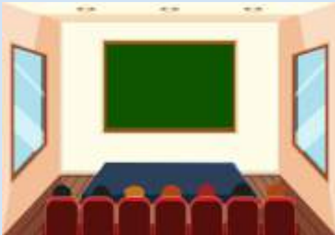
Panggung kelas sederhana