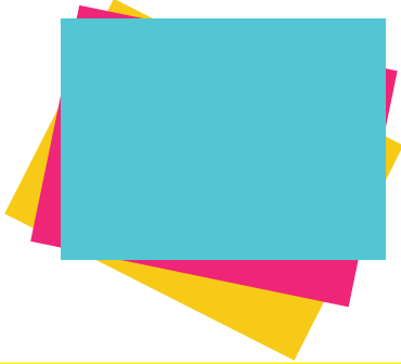
Kertas warna - warni