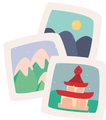
Gambar atau foto budaya (opsional)